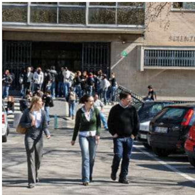
Studenti fuori dal Dipartimento di Economia e Scienze politiche